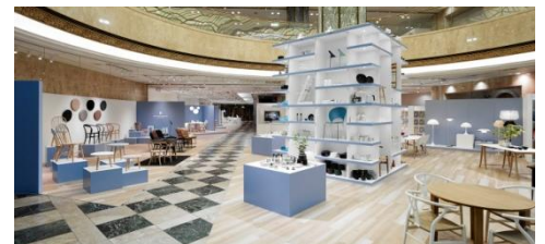
写真は IDC 大塚家具新宿ショールーム 1F

また、nendo/佐藤オオキが、老舗の曲木家具ブランド秋田木工の伝統のアーカイブをリ・デザインしたテーブル、ソファ、チェアなど、「EDITION BLUE」のために作られたオリジナルモデルも販売いたします。