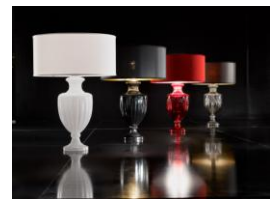
イタランプ社 / イタリア

この度オープンする「Lightarium (ライタリウム)」では、生活リズムとあかりの関係や様々な照明効果を知ることができ、実際にシュミレーションルームで照明を比較体感できる「Lighting Labo (ライティングラボ)」、ナショナルブランド、ノルディック、ユーロの最新照明を豊富に揃えた3つの「Brand Gallery」、ライフスタイルのコンセプト毎に照明での空間演出のノウハウやトレンド情報を発信する「Atelier Luce (アトリエ ルーチェ)」、カウンターで色とりどりのペンダントを体験しながら、ゆったりと情報収集できる「ペンダントカフェ」のほか、専門家が情報収集やプランニング、顧客との打ち合わせなどビジネスユースに活用できる「ビジネスセンター」なども展開。照明についての様々なアイデアや世界の最新情報を発信する新たな拠点として、多彩な照明計画を提案します。