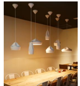
マーセット社 / スペイン