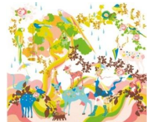
ホラグチカヨ 「sweet rain」 限定ジークレー* 8,400円