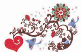
Kinpro 「flower x bear」 限定ジークレー* 8,400円