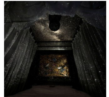
パーソナル向け超小型プラネタリウム 「MEGASTAR CLASS(メガスタークラス)」 投影イメージ

豊富な知識とわかりやすい解説で定評のある家電コンシェルジュ、神原サリー氏ならではの視点でセレクトされた、快眠をサポートする新家電とインテリアが集うコンセプトブース。暮らしを変える、新ライフスタイルをリアルに体験していただける場です。 会場:大塚家具新宿ショールーム 7F 眠りの大型専門店「Good Sleep Factory」内