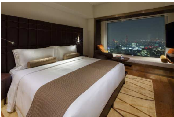
「ザ・プリンスギャラリー スイート」