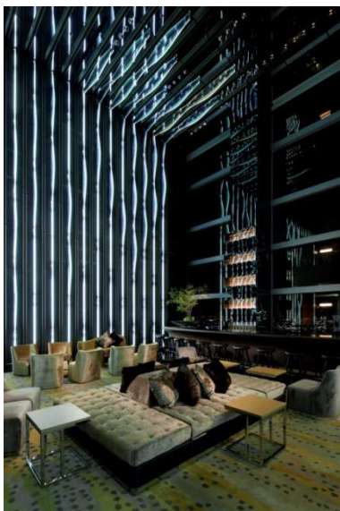
「Sky Gallery Lounge Levita」