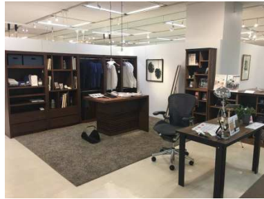
洋服好きのプライベートルーム提案