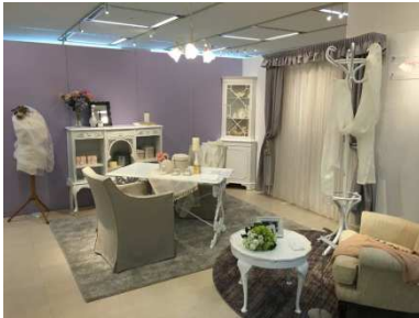
シャビーシックなコンパクトリビング提案

3階の専門ショップフロアでは、快適な住まいづくりのヒントやアイデアがわかる「住まいるステーション」をリニューアル。レイアウトの変更や収納家具の活用による「リフォームいらずのお悩み解決策」や、家具リフォームによる「インテリアのイメージチェンジ提案」、置き家具を用いた「クローゼット収納のヒント」など、お客様が日々の暮らしのなかで感じているご不満を解消し、暮らしを快適にさせていただくための新たなご提案をいたします。