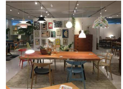
Scandinavian design with Art