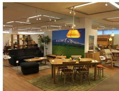
旭川家具のフロア