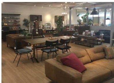
インダストリアル系ファニチャー

多種多様なインテリアを揃えた4階フロアでは、従来の「スタイル別」中心の構成を見直し、「壁面収納」「国産家具」「ワークチェア」などお客様のニーズが高い様々な切り口のゾーンを加えて再構成し、お客様がより見やすく、選びやすいフロアを目指しました。ニーズの高い「国内の優良産地家具」、「セミオーダー家具」、「ワークチェア」、「ユニット収納家具」などの品揃えも拡充し、トレンドの「インダストリアル系家具」の売場も新設いたしました。