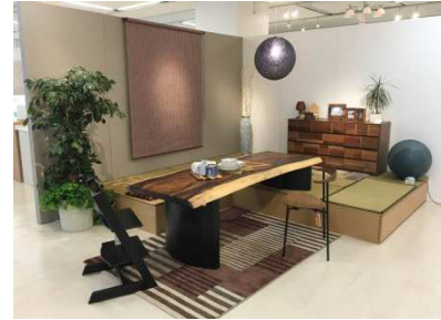
親子3世帯の集いの場の提案