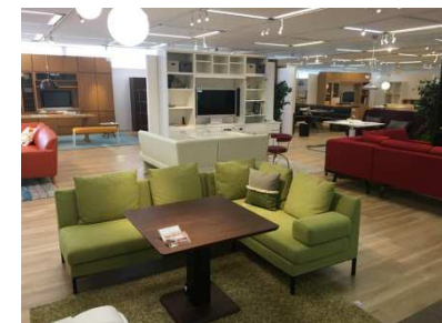
ユニット収納とラウンジスタイル